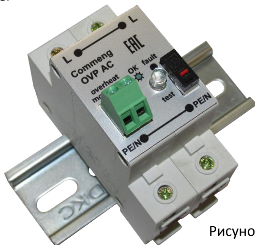
Рисунок 1. Внешний вид

Commeng OVP-2L AC 600/40 устройство защиты от импульсных помех (УЗИП), предназначенное для защиты электроустановок и цепей питания переменного тока до 600 В от импульсных перенапряжений. Внешний вид устройства показан на рис.1, функциональная схема на рис.2., основные технические характеристики приведены в таблице.