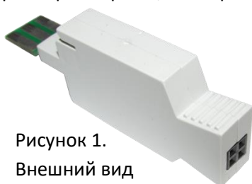
Рисунок 1. Внешний вид

В качестве опций имеются индикация срабатывания защиты от сверхтока ( DFP K3-SDLi ), и измерительный разъем ( DFP K3-SDLm ). Внешний вид модуля показан на рис.1, габаритные размеры на рис.2, электрическая схема (без индикатора и гнезд) на рис.3.