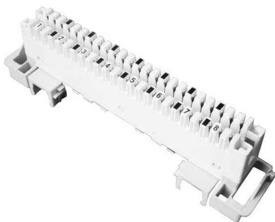
Рисунок 4. Плант LSA PROFIL 2/8 a,b,s, устанавливается в адаптер Commeng MA-DFK3)

Commeng MA-DFK2, плант уменьшенного размера, L=93 мм.