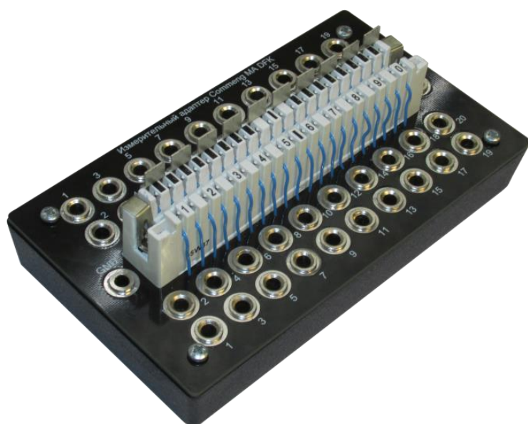
Рисунок 1. Внешний вид адаптера Commeng MA-DFK

Каждый из контактов плинта соединен с соответствующим ему измерительным гнездом для контактов типа «банан». Внешний вид адаптера показан на рис.1 , пример подключения измерительного прибора для проверки устройств, установленных в плинт – на рис.2