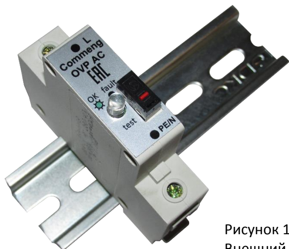
Рисунок 1. Внешний вид

Commeng OVP-2L AC 280/40 устройство защиты от импульсных помех (УЗИП), предназначенное для защиты одно- и трехфазных электроустановок и цепей питания переменного тока 220/380 (230/400) В от импульсных перенапряжений. Внешний вид устройства показан на рис.1, функциональная схема на рис.2., основные технические характеристики приведены в таблице.