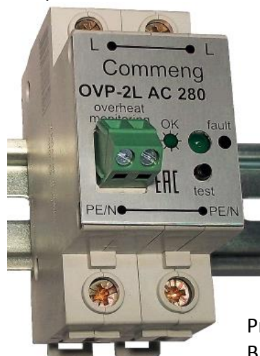
Рисунок 1. Внешний вид

Commeng OVP-2L AC 280/80 устройство защиты от импульсных помех (УЗИП), предназначенное для защиты одно- и трехфазных электроустановок и цепей питания переменного тока 220/380 (230/400) В от импульсных перенапряжений. Внешний вид устройства показан на рис.1, функциональная схема на рис.2., основные технические характеристики приведены в таблице.