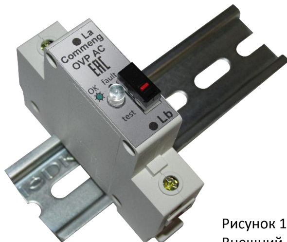
Рисунок 1. Внешний вид

Commeng OVP-2L AC 420/10 устройство защиты от импульсных помех (УЗИП), предназначенное для защиты трехфазных электроустановок и цепей питания переменного тока 220/380 (230/400) В от импульсных перенапряжений. Внешний вид устройства показан на рис.1, функциональная схема на рис.2., основные технические характеристики приведены в таблице.