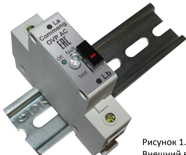
Рисунок 1. Внешний вид

Commeng OVP-2L AC 420/15 устройство защиты от импульсных помех (УЗИП), предназначенное для защиты трехфазных электроустановок и цепей питания переменного тока 220/380 (230/400) В от импульсных перенапряжений. Внешний вид устройства показан на рис.1, функциональная схема на рис.2., основные технические характеристики приведены в таблице.