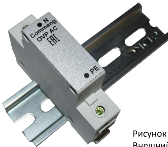
Рисунок 1. Внешний вид

Commeng OVP-2N AC 280/15 устройство защиты от импульсных помех (УЗИП), предназначенное для защиты одно- и трехфазных электроустановок и цепей питания переменного тока 220/380 (230/400)В от импульсных перенапряжений. Внешний вид устройства показан на рис.1, функциональная схема на рис.2., основные технические характеристики приведены в таблице.