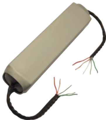
Рисунок 1. Внешний вид репитера Commeng RPT 100B-TX v3.0 c/c

Репитер Commeng RPT 100B-TX v3.0 применяется для подключения по интерфейсу 10/100 BASE-TX (Fast Ethernet) в тех случаях, когда расстояние между оборудованием (например, коммутатором и IP-камерой) превышает максимально допустимую стандартом IEEE 802.3и длину физического сегмента.