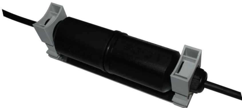
Рисунок 3. Внешний вид основания монтажного ОМ КНУ-2 после монтажа и сборки с оборудованием (коробкой КНУ-2 и т.п.).

2.4 Для снятия оборудование (коробку КНУ-2 и т.д.) с основания монтажного необходимо использовать отвёртку.