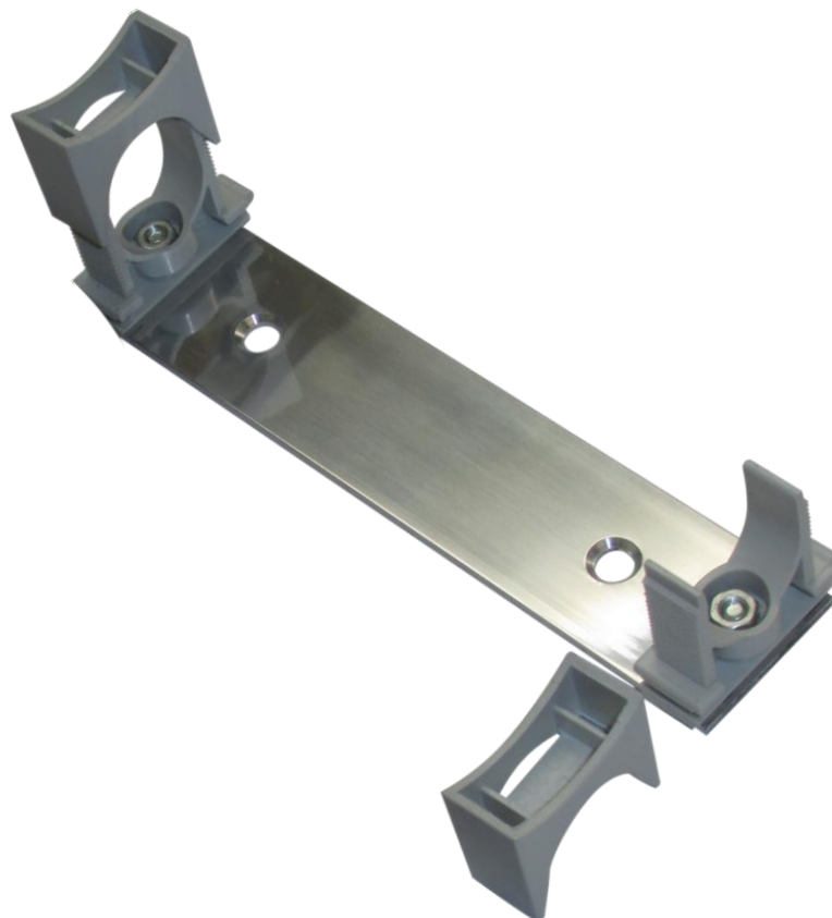
Рисунок 1. Внешний вид основания монтажного ОМ КНУ-2

Основание монтажное ОМ КНУ-2 предназначено для установки на поверхность, стены, потолки, металлические и строительные конструкции или на трубостойки, опоры, столбы в основном коробок наружной установки Commeng КНУ-2 (КНУ-2з), а также устройств защиты Commeng FEP M f/m OD, Commeng Cat5P M f/m OD, Commeng ODU-Protect OD FE, Commeng ODU-Protect OD GE.