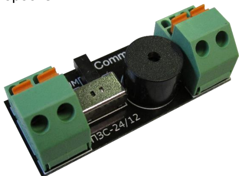
Рисунок 1. Внешний вид платы звукового сигнала ПЗС-24/12

Питание платы ПЗС-24/12 осуществляется безопасным постоянным напряжением 24 В или 12 В. Плата может размещаться сзади сигнальной панели в стене или в монтажной коробке.